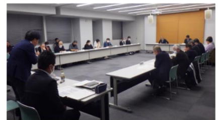
当日の会議の様子

各委員からの、「学童保育はどうなるのか。」「2校残すということは考えていないのか。」「ハードを新設することはできないのか。」「学びの多様化学校は各学校に置くのか。」「バス通学についての確認がしたい。」「不登校が増えてきているが統合によって解消するのか。」「教育方針を一緒にするのは良いことだと思う。」などの質問や意見に対して事務局が回答し、次回は「統合先（使用する校舎）を3校のどこにするか。」と「統合の具体的な時期について。」の2点について、次回以降具体的に協議していくことを再確認しました。