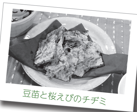
豆苗と桜えびのチヂミ

④熱したフライパンに、ごま油（1/2量）を入れ③の生地（1/2量）を流し両面カリッとするまで焼く。