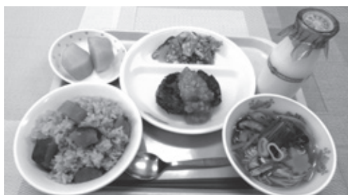
【調理献立】 さつまいも入り大和茶飯、牛乳、宇陀の牛肉と宇陀金ごぼうのハンバーグ（柿ソース）、きらずのたいたん、黒豆煮麺、大和の柿