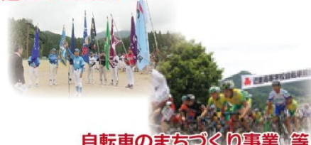
自転車のまちづくり事業 等