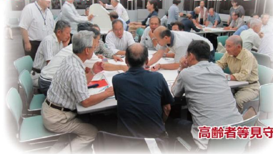
高齢者等見守り隊