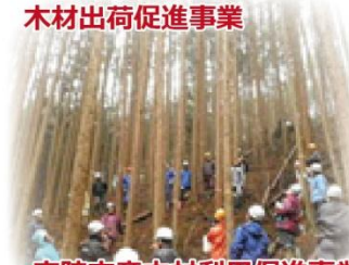
宇陀市産木材利用促進事業