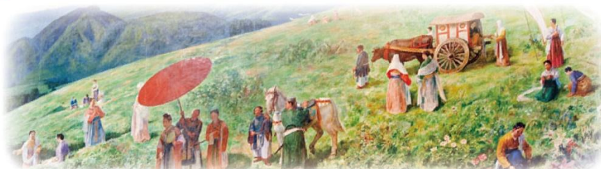
「推古天皇薬猟壁画」星薬科大学所蔵