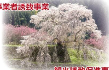
観光誘致促進事業 等