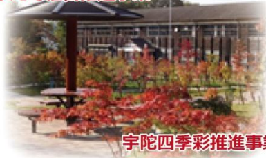
宇陀四季彩推進事業