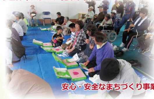
安心・安全なまちづくり事業