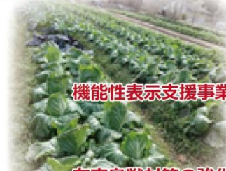
機能性表示支援事業