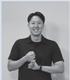
両手の小指を曲げて上下にからませる