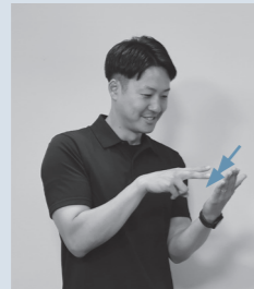
左手のひらに向けた右手2指の指先を2回下ろす