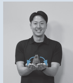
両手のひらを合わせ、小指側を軸にして両手を開く