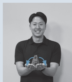
両手のひらを合わせ、小指側を軸にして両手を開く【本】