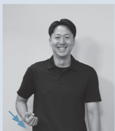
右手こぶしの小指側で右わき腹を2回たたき、【面白】