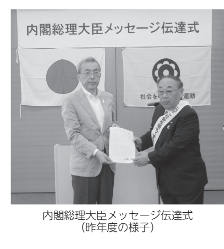
内閣総理大臣メッセージ伝達式 (昨年度の様子)

今年で第76回目を迎える同運動を実施するにあたり、宇陀地区内でも保護司・更生保護女性会が中心となり市民への啓発活動を展開します。