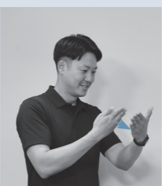
左手のひらに右手の4指(背側)を右へ少しずらして2回あてる【絵】