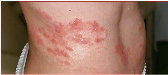
带状疱疹 (部位：腹囲)