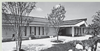
▲奈良県立万葉文化館