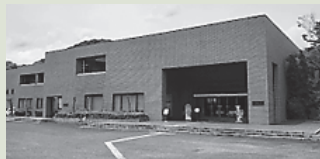
▲橿原考古学研究所附属博物館

問 中央公民館（☎ 83・0551 / IP ☎ 88・9180）【休館日】木曜日・祝日