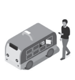
無人で荷物を受け取り