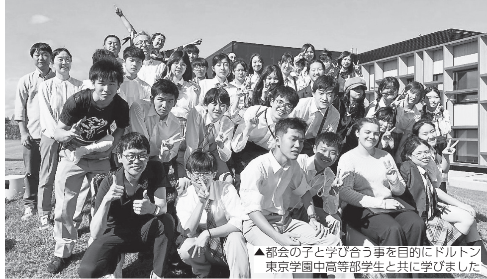
▲都会の子と学び合う事を目的にドルトン 東京学園中高等部学生と共に学びました