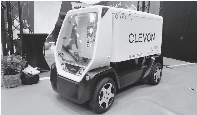
▲エストニアのロボティクス企業が開発した 中速中型自動配送ロボット「Clevon 1」

用の可能性について情報共有、意見交換を行いました。 新しいロボット技術を地域で活かしていくためには、技術だけでなく、制度面や運用環境を整えることが必要です。市では、まずはその基盤づくりに取り組んでいます。 会議参加：経済産業省、近畿経済産業局、奈良県、奈良工業高等専門学校、パースルテクノロジー、ナガセテクノサービス、Next innovation、JETRO 奈良、ロボットデリバリー協会、手原産業倉庫、出前館、三井住友海上火災保険