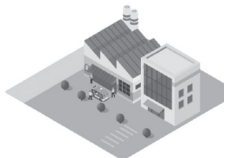
事業拠点間を無人配送 (B2B 搬送)