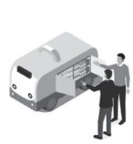
無人で商品を販売