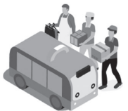
小売店商品・宅配便 を無人配送